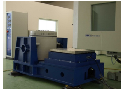
Dieses Bild zeigt unsere 35kN-Schwingprüfanlage und die Klimaprüfkammer.